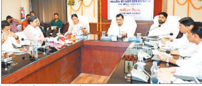
अधिकारियों की बैठक लेते उद्योग मंत्री लखन देवांगन।