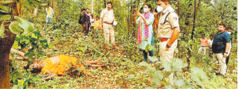
घटनास्थल की जांच पड़ताल करती पुलिस व फॉरेंसिक एक्सपर्ट की टीम।