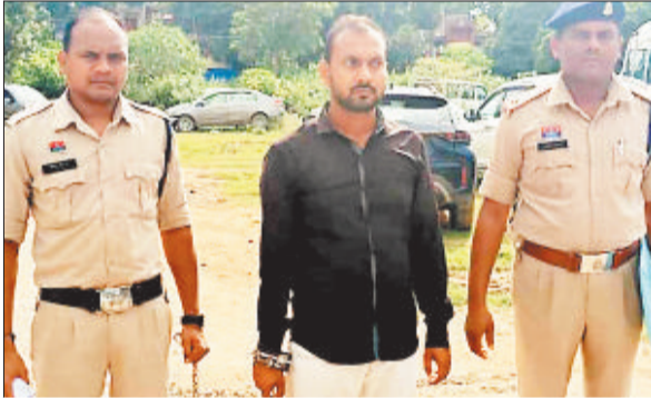
पुलिस गिरफ्त में आरोपी।

एक साल पूर्व एक विवाहिता की मौत सर्पदंश से होने की बात सामने आई थी लेकिन पुलिस ने मामले में मर्ग कायम कर जांच शुरू की। एफएसएल रिपोर्ट आते ही खुलासा हुआ कि उसमें विष नहीं पाया गया है