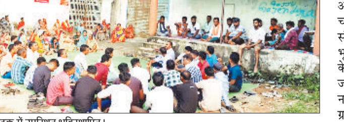
बैठक में उपस्थित भूविस्थापित।

एक तरफ जब समूचा देश और जिलेवासी आजादी का जश्न मना रहे थे, तो दूसरी तरफ अपने अधिकारों को पाने की चिंता में खदान प्रभावित गांवों के लोग बैठक में चिंतन-मनन करते नजर आए। प्रबंधन के साथ बनी सहमति के बाद भी निराकरण न होने से यह व्यथित हैं और मांगों के संबंध में फिर प्रशासन को अवगत कराते हुए आंदोलन की तैयारी कर रहे हैं। एसईसीएल की गेवरा परियोजना के अर्जित ग्राम नरईबोध के बसाहट एवं रोजनगर के संबंध में अनुविभागीय अधिकारी (राजस्व) कटघोरा विधायक