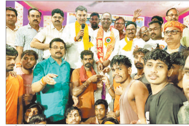
मटकी फोड़ विजेता टीम।

श्री कृष्ण जन्माष्टमी के पावन अवसर पर प्रगति नगर राधे कृष्णा मैदान में सफलतापूर्वक 26 वें वर्ष मटका फोड़ महोत्सव दहीहंडी प्रतियोगिता संपन्न हुई देर रात तक चले इस कार्यक्रम में टीक 12:15 में दही हंडी को फोड़ कर अड़ी कछार की टीम