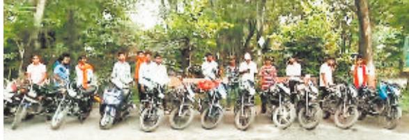
जात बाइक व चालक।