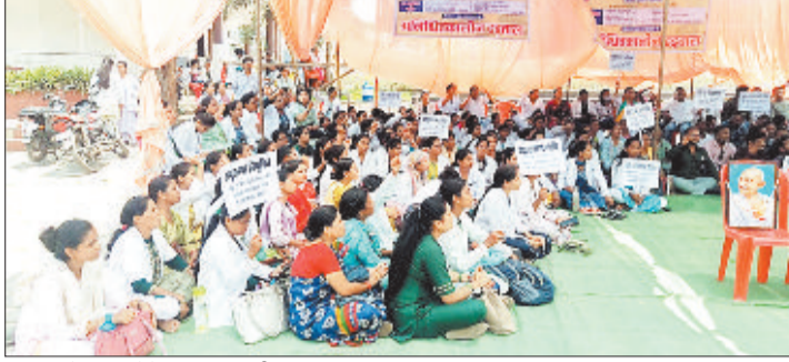
घंटाघर में धरना देते स्वास्थ्य कर्मी।

अपनी 10 सूत्रीय मांगों को लेकर राष्ट्रीय स्वास्थ्य मिशन (एनएचएम) के जिले में पदस्थ 7 सौ से अधिक स्वास्थ्य कर्मचारी सोमवार से अनिश्चितकालीन हड़ताल पर चले गए हैं। प्रदेशव्यापी हड़ताल की कड़ी में जिले के हड़ताली कर्मियों ने अपनी भागीदारी देते हुए घंटाघर चौक में धरना शुरू कर दिया है।