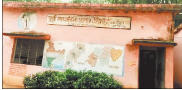
जर्जर स्कूल भवन।

स्कूलों की स्थिति सुधारने के लिए डिस्मेंटल की योजना तैयार की गई थी ताकि ऐसे स्कूलों की जगह नए भवन बनाया जा सके। किंतु पुराने और अति जर्जर स्कूल डिस्मेंटल ही नहीं हो सके हैं। ऐसे में नए भवन निर्माण बनाए जाने का रास्ता नहीं खुल सका है। जबकि इसके लिए डीएमएफ से एक बड़ी राशि जारी करने के आदेश भी जारी हो चुके हैं। स्कूलों की खराब स्थिति विशेषकर ग्रामीण अंचलों में है। हालांकि ऐसे स्कूलों में शहर के स्कूल भी पीछे नहीं हैं। इनमें वार्ड क्रमांक 40 के रिस्दा प्राथमिक शाला जिसकी बांडड़ीवाल तीन जगह से क्षतिग्रस्त हो गई है। इसके अलावा केशलपुर प्राथमिक शाला जिसके छत से पानी रिसता है। ये शहर के नजदीक और शहर में ही स्थित स्कूल हैं। कुछ ऐसे स्कूल भी हैं जो पिछले चार साल से अधूरे चल रहे हैं। जिन्हें डिस्मेंटल करना जरूरी था किंतु न तो उनका निर्माण